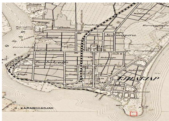
Gambar 1. Wilayah Karesidenan Banyumas pada tahun 1900 (Tjilatjap, Java – Residentie Banjoemas, 1900 (excerpt) )