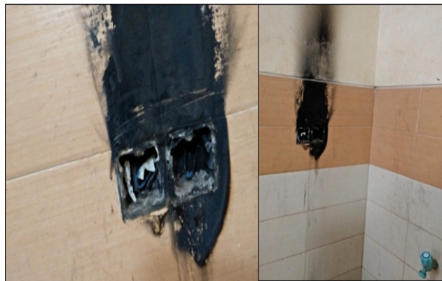
Gambar 4. Terbakarnya saklar di ruang toilet putra lantai 1 Gedung C

Gedung E (Rusunawa putra dan putri), secara karakteristik lokal gedung ini adalah untuk penggunaan kegiatan dormitori asrama mahasiswa pada lantai dua, tiga dan empat. Pada lantai satu difungsikan sebagai ruang belajar dan aula. Dilihat dari penggunaan ruang yang juga sebagai asrama mahasiswa. Terdapat 10 kamar pada tiap lantai dengan kapasitas empat orang per kamar. Dari kondisi tersebut maka keadaan rentan atas penggunaan sebagai tempat tinggal asrama dan kelas.