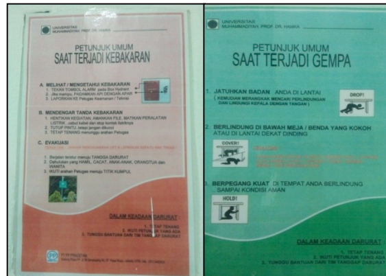
Gambar 5. Petunjuk Keselamatan bahaya kebakaran dan gempa bumi

Pada hasil penelitian ini kesiapsiagaan teknis yang dipersiapkan oleh PT Pancatiara selaku rekanan kerja menunjukkan adanya upaya dalam pengadaan petunjuk keselamatan saat berada di lingkungan kampus B UHAMKA. Upaya yang ada dilihat cukup dengan kapasitas minimal yang berarti masih belum dijadikan hal yang primer sebagai kebutuhan dalam penggunaan gedung di lingkungan Kampus B Uhamka. Dapat dikatakan minimal dilihat atas jumlah petunjuk kesehatan yang ada dan ukuran besar dari media yang digunakan.