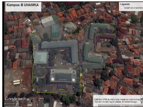
Gambar 1. Peta Situasi Kampus B UHAMKA.( googleearthpro)

Penelitian dilaksanakan pada lokasi kampus B UHAMKA Pasar Rebo, yang terletak di Jalan Tanah Merdeka Kelurahan Rambutan, Ciracas Jakarta Timur. Lokasi digambarkan dalam peta citra dengan kenampakan lingkungan sekitar kampus B UHAMKA (Gambar. 1). Waktu Penelitian dilaksanakan pada Bulan Juni 2017.