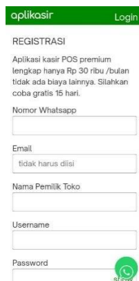
Gambar 1. Halaman register Berdasarkan gambar 1 menunjukkan langkah awal memulai aplikasi dengan mendaftarkan data yang dibutuhkan seperti nomor whatsapp , email , username , dan password .