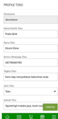
Gambar 3 profil usaha

Pada profil usaha terdapat informasi umum seperti nama usaha, alamat, nomor telepon yang akan memudahkan informasi tentang profil usaha pada struk penjualan ketika selesai transaksi penjualan.