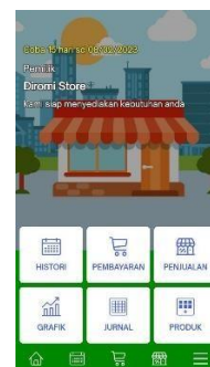
Gambar 4 halaman utama Pada halaman utama terdapat histori penjualan, pembayaran, penjualan untuk melakukan transaksi jual beli, grafik penjualan, jurnal rekapan harian maupun bulanan, dan penambahan produk baru.