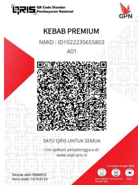
Gambar 6 Gambar qriss kebab premium