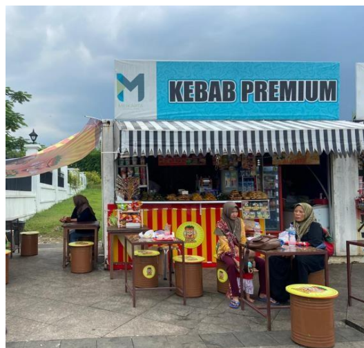
Gambar 1 Tempat umkm kebab premium

Saat ini sudah banyak orang yang memakai qriss untuk pembayaran digital untuk itu peneliti ingin mengetahui efektivitas penggunaan qriss di umkm "kebab premium".