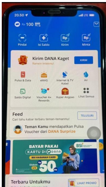
Gambar 4 Akun dana pemilik kebab premium sebelum menggunakan qriss.