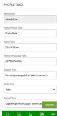
Gambar 3 profil usaha

Pada profil usaha terdapat informasi umum seperti nama usaha, alamat, nomor telepon yang akan memudahkan informasi tentang profil usaha pada struk penjualan ketika selesai transaksi penjualan.