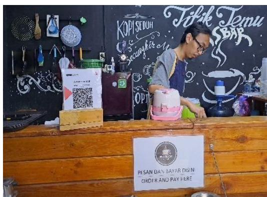
Gambar 1 Peletakan QRIS di Warung Kopi ASBAR

Hasil yang didapatkan lewat wawancara bahwa adanya QRIS sangat membantu proses transaksi. Pemilik usaha tidak perlu mempersiapkan banyak produk atau macam QR Code di usahanya, hanya cukup menyediakan satu QRIS saja dapat menerima semua transaksi dari berbagai instrument pembayaran berbasis server. Peranan QRIS ini membantu pemilik usaha untuk tidak tertipu pada peredaran uang palsu, mengurangi resiko pencurian uang dan mendukung pemerintahan dalam mengembangkan perekonomian digital pada wilayah tertentu. Pemilik usaha juga mengatakan dengan adanya QRIS dapat menghindari kesusahan mengembalikan uang pelanggan yang nominalnya besar maupun kecil. Selain untuk mempermudah transaksi, sistem pembayaran QRIS membantu pemilik usaha untuk mencatat pendapatan harian.